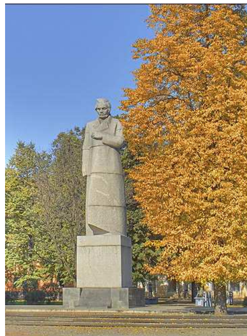
Памятник М. Кольцову

Клювокрыло клювокрылое Клювокрыло Сменяющееся. Любимое.