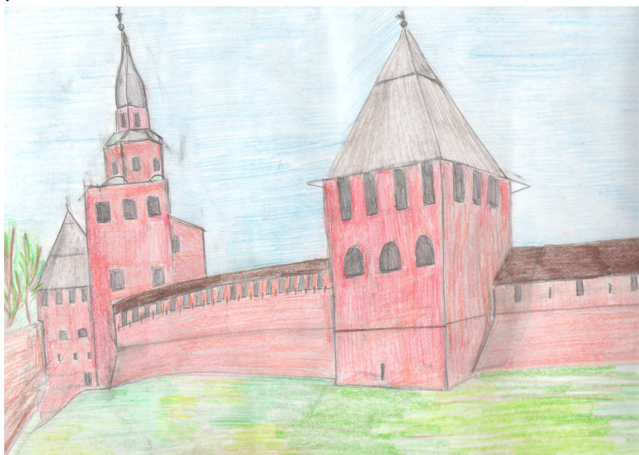
рисунок Ттолины Степанян, 8Г