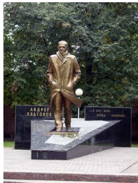
Памятник А. Платонову