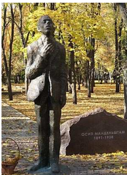
Памятник О. Мандельштаму

Ах, моя судьба. Любви недостойная. Любимая. Ах, Народ Родины моей. Величие растерявший. Великий. Ах, старина моя. Забвения недостойная. Забытая. Ах, грязная грязь. Грязно грязная грязью Черная. Ах, ветки дерева скупые. На черноземе выращенные. Сухие. Ах. Клювокрыло.